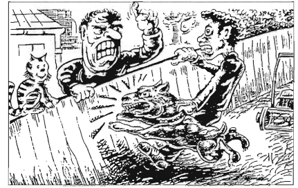
Geskille wat buite die hof geskik word

Vernuwend onderwysmetodes word aangewend en die studentetekste is met strokiesprente geïllustreer om hulle leser vriendelik en meer toeganklik te maak. Elke teks bevat kort beskrywings van regs-beginsels en stel vrae en probleme