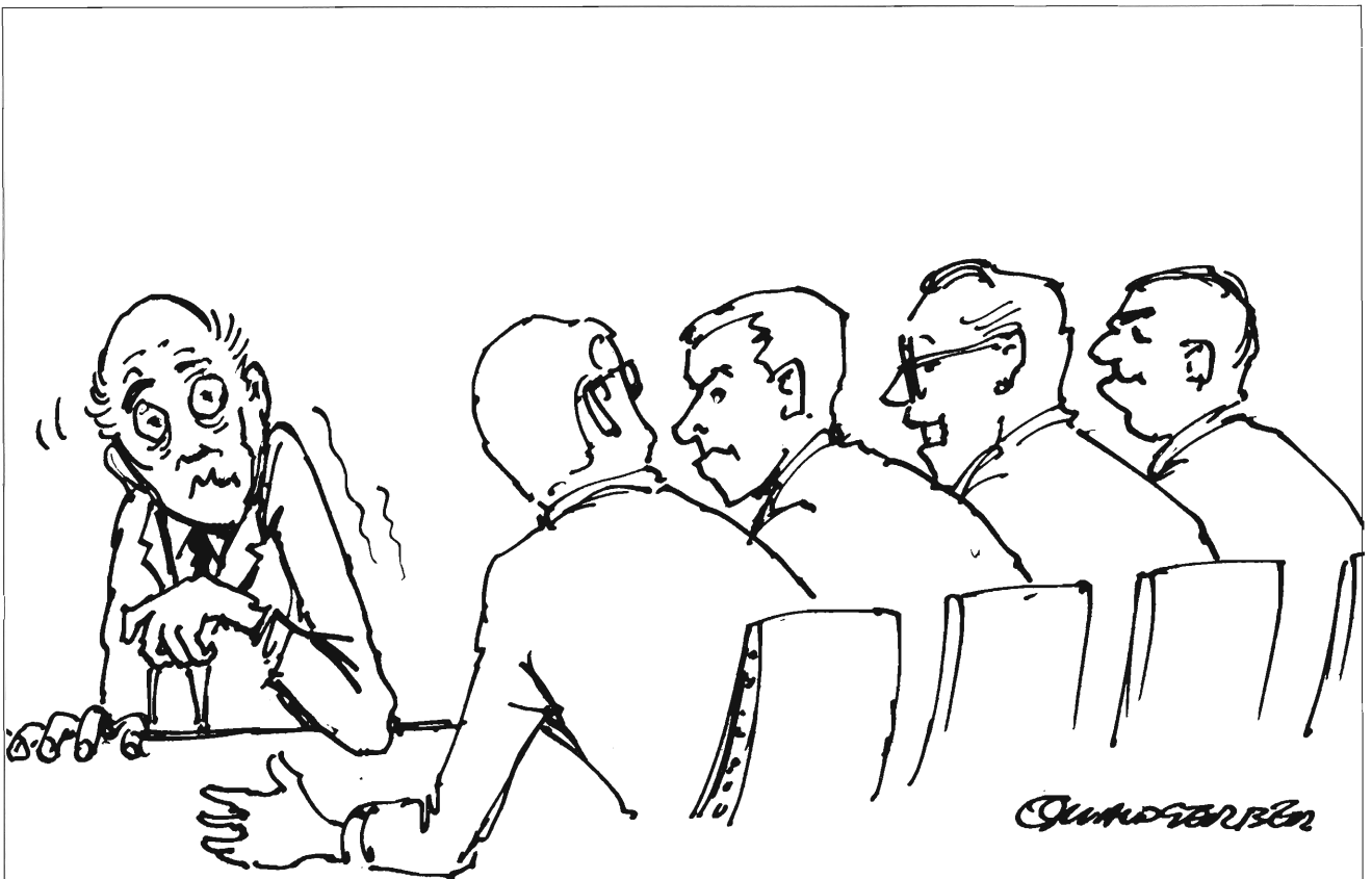
Grilling during oral exam