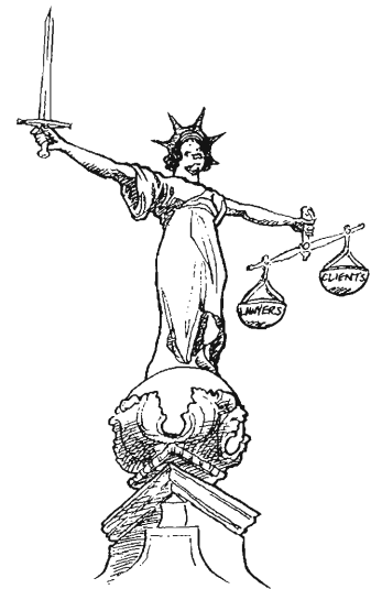
From Steuart & Francis Queen's Counsel (London)