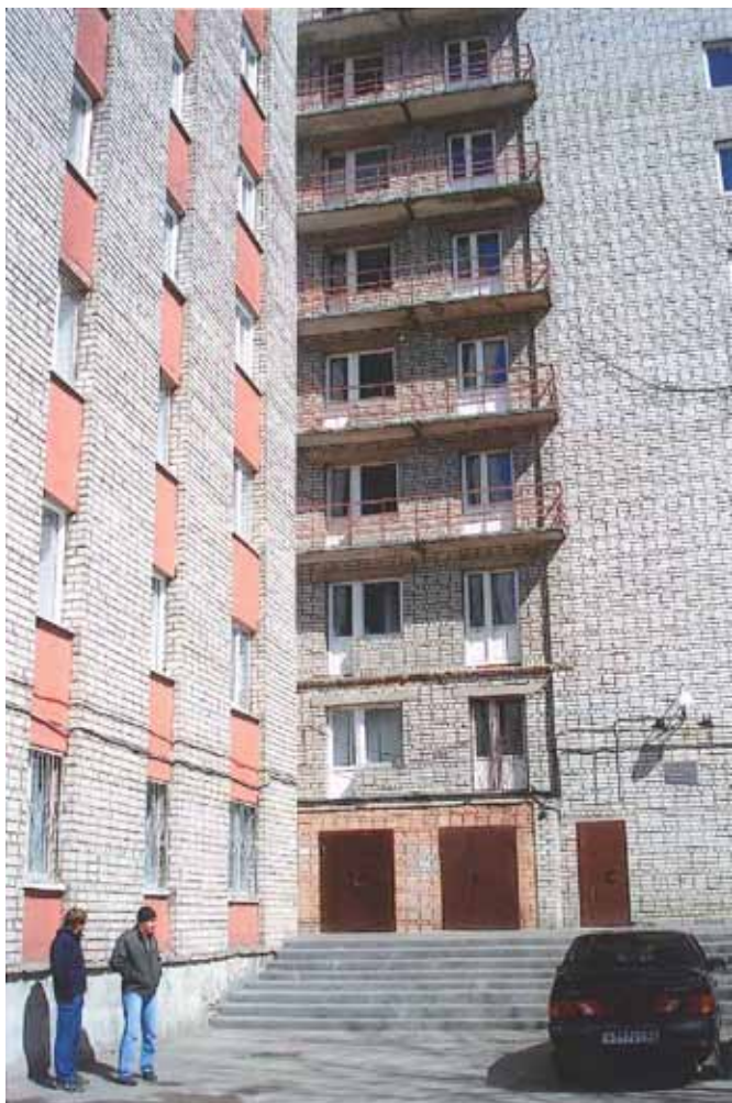
Die koshuis in Ryazan. Droewige Soviet-argitektuur. Dit leef so somber as wat dit lyk.

'n spoor van hom te sien nie. Lenin bly egter maar 'n meneer in dié geweste.