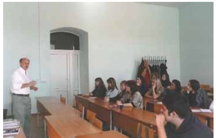
Een van die klasse by Ryazan. Dis reeds vroeë lente, maar die hakke hang steeds dik van die jasse en serpe.

Ek skop my kursus af met 'n bespreking oor die rol van geestesvryheid in die verloop van beskawing. Nie so lank gelede nie sou dit my in Sibirië laat beland het. Iemand praat, want die volgende dag sit die hele geskiedenis-departement in die klas. Ek weet nie wat om daarvan te maak nie. Nee wat, dink ek, te ver gekom om katvoet te loop. Tyd vir leeu-loop. Ek haak af en gee hulle 'n brander