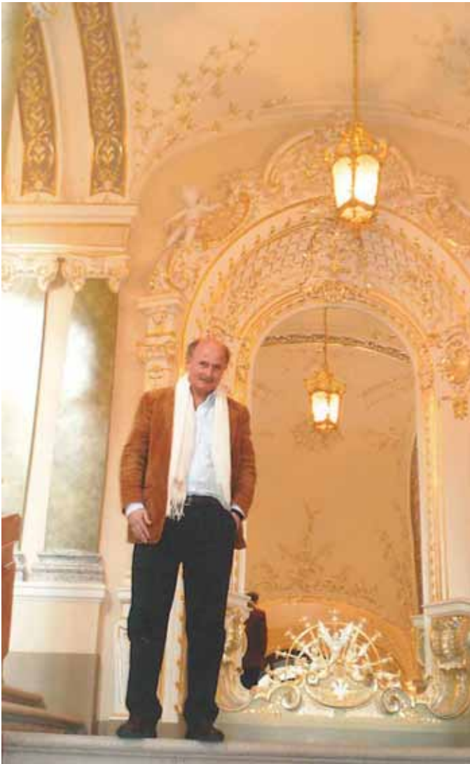
Die vergulde operahuis van Odessa.

mekaar vind. Hy verstaan later dat ek van Suid-Afrika af kom. 'n Lig gaan vir hom op. 'Deutsch!' sê hy. Ons voel soos Archimedes. In die ou dae het hy 'n tyd lank in Oos-Berlyn gewerk. So tussen sy Duits en my Afrikaans deur kom ons nogal gou-gou reg. Nog nooit my taal so lief gehad nie. Die rit is 'n avontuur. Die motor is 'n ou, ou Lada. Van skokbrekers is daar geen sprake nie en my sitplek is ook so 'n bietjie los. Ek klou vir 'n vale aan die deur se handvatsel. Die bestuurder gee my 'n groot glimlag. 'n Tandarts se droom, dog ek nog, toe maak hy weer 'n skerp draai en ek skuif weer 'n bietjie rond in die motor. Ons lag alte lekker. Ten minste gaan ek nie vannag verkleum nie.