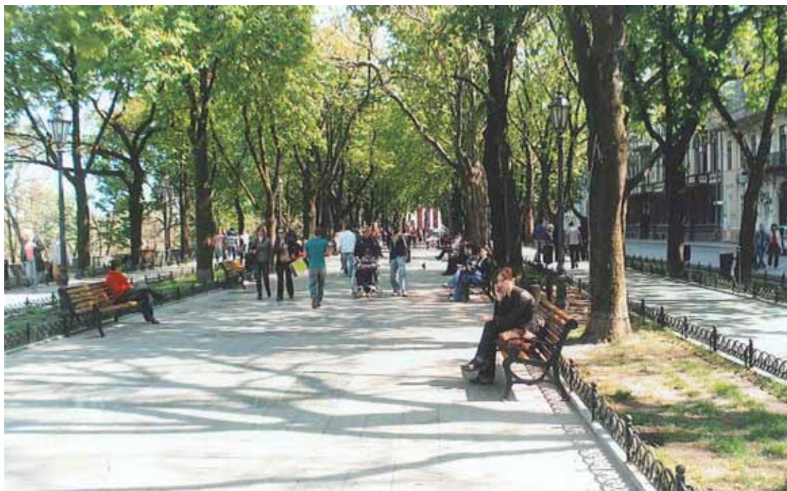
Die Promerskii-boulevard. Links, buite die foto, val die kranse tot by die Swart See weg.

daarvan. Dit is darem 'n groot voordeel vir kinders om in 'n boekehuis groot te word. Dit was sekerlik waar vir die Pavlov-seuns. Almal het suksesvolle wetenskaplikes geword. Op 'n paar uitsonderings na, was 'n ongeskoolde verstand (selfs 'n goeie een) vir die wêreld se vooruitgang meestal maar 'n taamlik nuttelose ding. Soms is dit selfs gevaarlik, veral as dit vasgevang is in 'n wispelturige of barbaarse gees. Geleerdheid is nie alles nie. Verreweg nie. Sekerlik moet dit nie met beskawing verwar word nie. Dit ten spyte – vir geleerdheid is daar darem ook geen plaasvervanger nie. Daar is ook geen substituuat vir verstand nie. Somtyds, soos met Pavlov, val die kaarte net mooi reg. Dit is dan wanneer beskawing sy groot treë gee, veral as dit met fokus en energie gepaard gaan. Wat 'n vreugde as al dié talente boonop in 'n goeie siel setel.