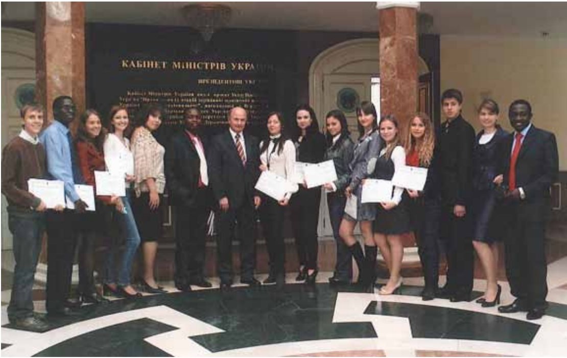
Sommige van die Odessa studente en hulle sertifikate.

Moorse dokter kan haar genees, maar, so sê hy, slegs as sy die begeerte het om te sien. Maar sy wil nie, want 'n lewe in die lig beangs haar. Toe raak sy verlief, wil sien en word genees. Die liefde, so sê Tchaikovsky, maak alles reg. Een van my heerlikste aande in die teater.