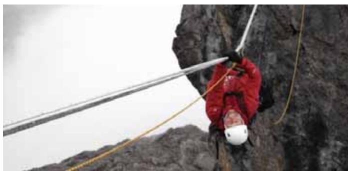
Tirolse dwarsgang op Carstentz Pyramid, 2009.