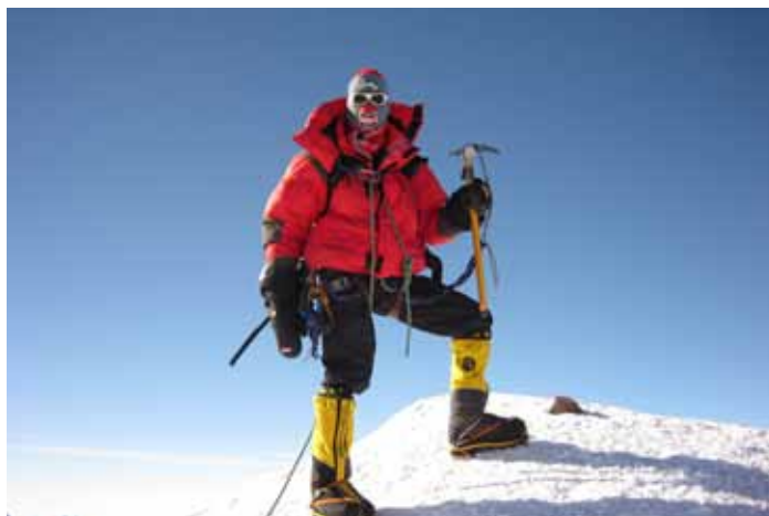
Vinson Massif-kruin, 2009.